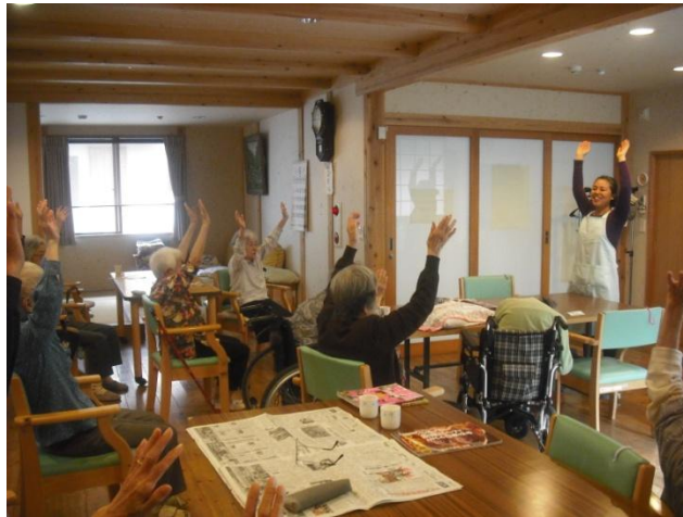
最近、お昼前の体操に「笑いヨガ」を導入しています。 体の負担が少ないし、「笑う」って体にすごくいいんですよ。

平成二十二年五月一日、倶楽部千代田會館は初めてのご利用者様をお迎えしました。まだ建物の中は新築の匂いで一杯でした。新規のオープンですからスタッフはみんな緊張していました。私を始め、全く畑違いの職業からの転職組はそれこそどう振舞って良いのか手探り状態でした。四月の始めからスタッフ研修が始まり、グループ内の他の事業所での実地研修や施設内で接遇シミュレーションな