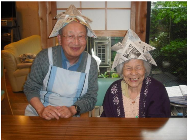
ボランティアさんと一緒にかぶってポーズ！

ゴールデンウィークは、多くのご利用者様で賑わいました。こどもの日を前に、みんなで新聞紙の折り紙でかぶとを折ってみました。昔はみんなよくこれを折ってはかぶって野山を駆け回っていたんじゃないんじゃないでしょうか。みんな折り方を忘れちゃったよなどとおっしゃっていましたが、折っているうちに「ああ、そうだった」と少しずつ幼い頃に折った思い出を蘇らせていらっしやいました。倶楽部千代田會館にはこどもはいます。この日だけはみんなこどもに帰って楽しんでいらっしやいました。