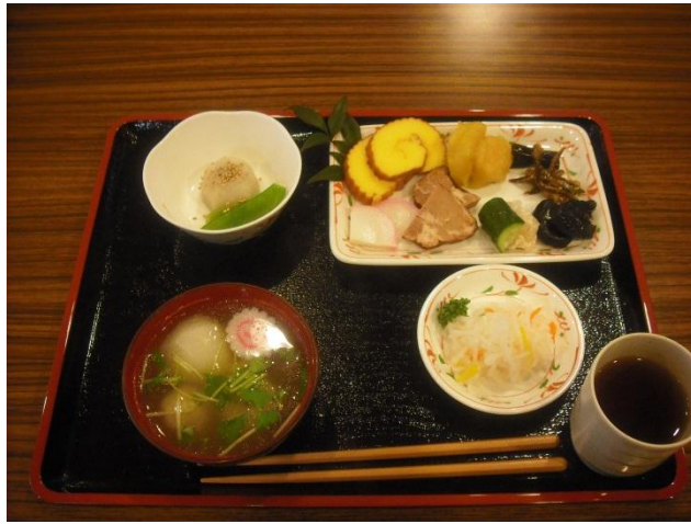
三が日のお風呂はんはみんなで特製のおせち料理を食べました。誰ですか？「お酒が無いわね」とか言っている人は？手作り感覚あふれるおせちはとてもおいしかったです。

新年あけましておめでとございます。本年も倶楽部千代田會館をよろしくお願い申し上げます。平成二十五年初めての千代田だよりをお届けいたします。やっぱり日本人、クリスマスよりお正月に特別なものを感じるものですね。大みそかの夜って何かワクワクします。と、思ったのですが、長い人生を送ってこられた方々にはどれもいつも通りの出来