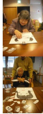
手作りの福笑いを楽しんでいただきました。目をつぶってパーツを顔の上に乗せていただき、目を開けてビックリ！