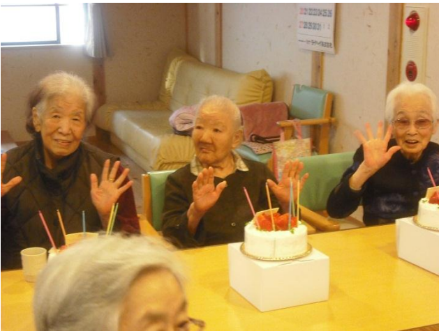
「昔は一月一日にみんなで一つずつ年を取ったもんだよ」ご高齢の方で1月1日をお誕生日にされている方は結構おられます。他の1月生まれの方々と一緒におめでと！

事なのかもしれません。紅白歌合戦の結果も気になさらず、殆どの皆さん早々に寝付かれてしまいました。静かになった二階のフロアに除夜の鐘だけが遠くに響いていました。一日はおせちを食べてのんびりと過ごし、お正月らしさを満喫しました。二日はみんな近所の氷川神社に初詣に出かけました。書