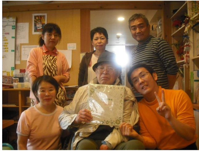
別の施設に移られるご利用者様にスタッフ全員で書いた寄せ書きをお渡ししました。何だか卒業式みたいです。

「千代田だより」もお陰様で創刊二周年を迎えることができました。いつもご愛顧いただき誠にありがとうございました。いつもご愛顧いただきありがとうございましたので、改めて私たちが施設の自己紹介をさせていただきます。 倶楽部千代田會館は平成二十一年五月にオープンした、今年五月で四周年を迎えるまだまだ新しい施設です。当館がご提供するサ-