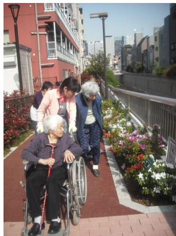
つつじて溢れる神田川沿いをお散歩します。暖かくて気持ちのいい日でした。

いております。「小規模」という名の通り一日の通い利用者数は十五名以内という小さな介護施設ですので、大きな施設と比較して、細やかに目の行き届いた家族的な雰囲気をご利用者様に感じて頂けていると思っております。 スタッフがひとりひとりのご利用者様に関われる時間が長く、ひとりひとりのご利用者様のお話をじっくりと伺い、とことん寄り添い続けることが出来るのは、小規模な施設ならではのメリットであり、かつご利用者様のご家族の皆様が私たちの施設に一番期待されているところだと実感しています。 本年度も私たちはご利用者様に「寄り添い」つづけます。よろしくお願ひいたします。