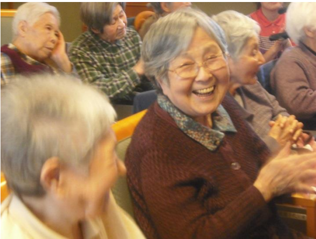
ある春の日の楽しいコンサートにて

ビスの形態は「小規模多機能型居宅介護」と言います。完全入居型の施設とは異なり、ご家族による在宅での介護を基本に、デイサービスにあたる「通い」、ショートステイにあたる「宿泊」、そしてご自宅への「訪問」のサービスをご家庭、ご利用者様の実情に合わせて提供すること、日々介護をされているご家族様のお手伝いをさせていただ